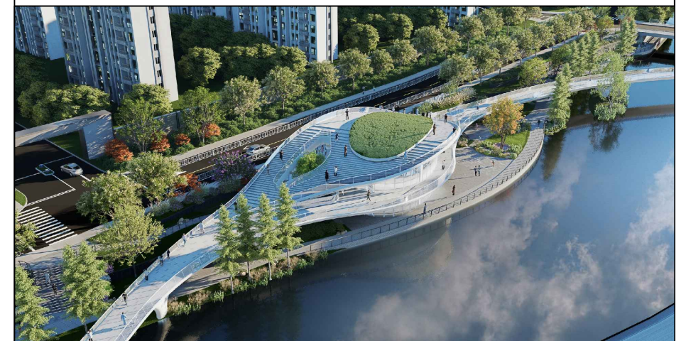
方案效果图（仅为示意）