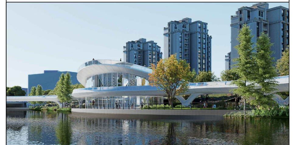
方案效果图（仅为示意）