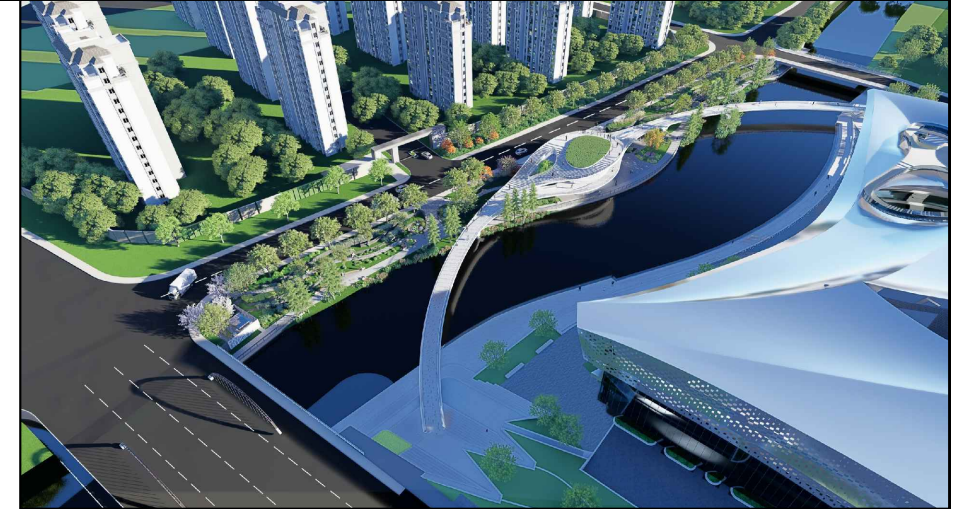
方案鸟瞰图（仅为示意）