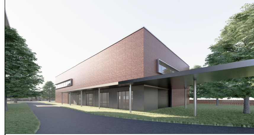
单体效果图（仅为示意）