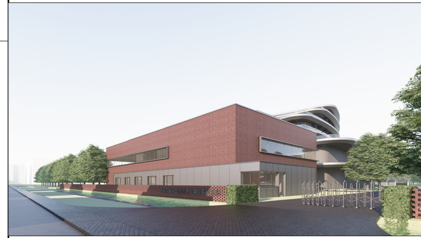
单体效果图（仅为示意）