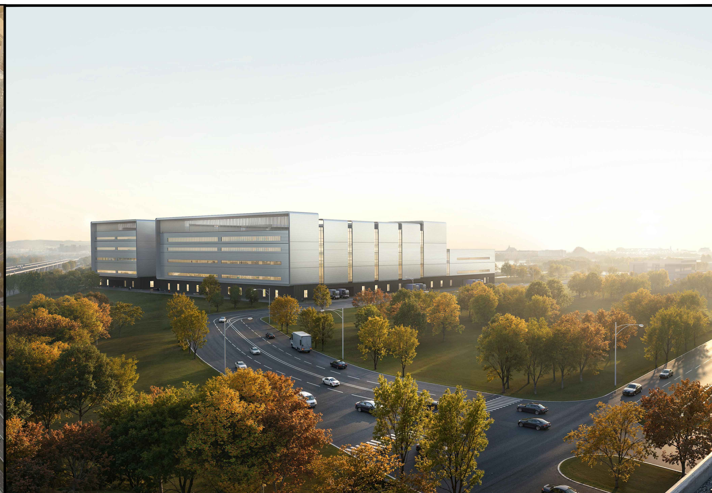
单体效果图（仅为示意）