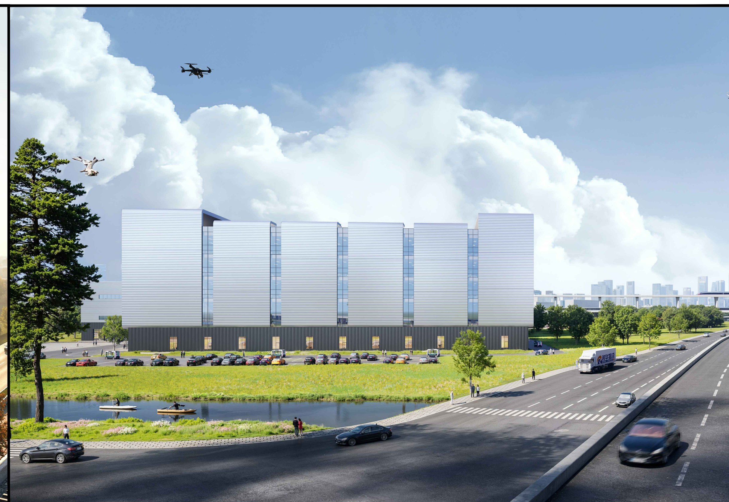
单体效果图（仅为示意）