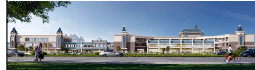
B01建筑沿安阳山路透视图（仅为示意）