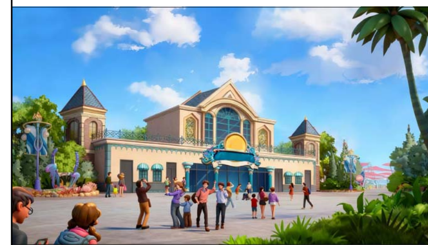
B03建筑透视图（仅为示意）