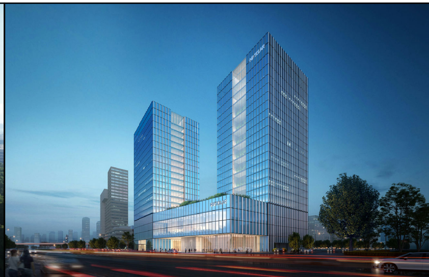
沿街效果图（仅为示意）