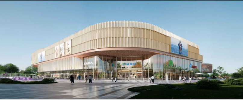
西侧透视效果图(仅为示意)