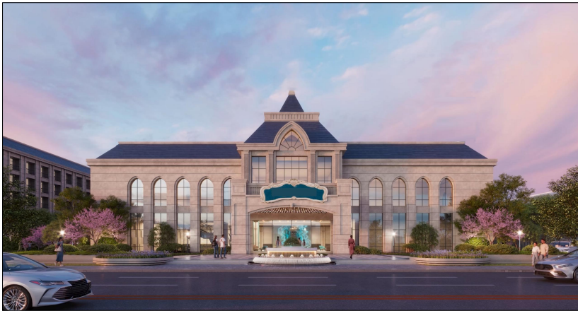
沿清德路效果图（仅为示意）