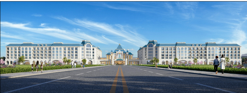
沿陆昌路效果图（仅为示意）