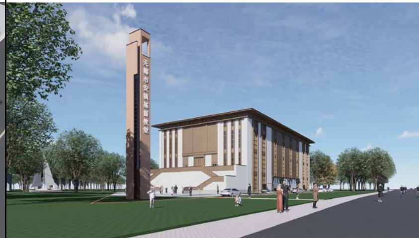
单体效果图 (仅为示意)