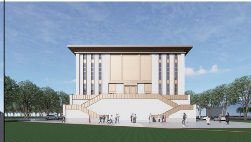
单体效果图 (仅为示意)