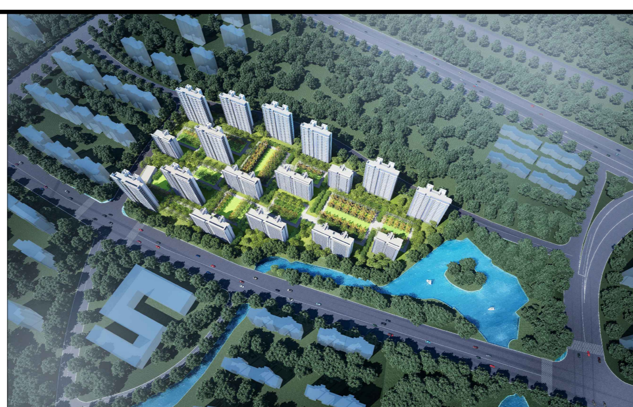
变更前鸟瞰图 (仅为示意)