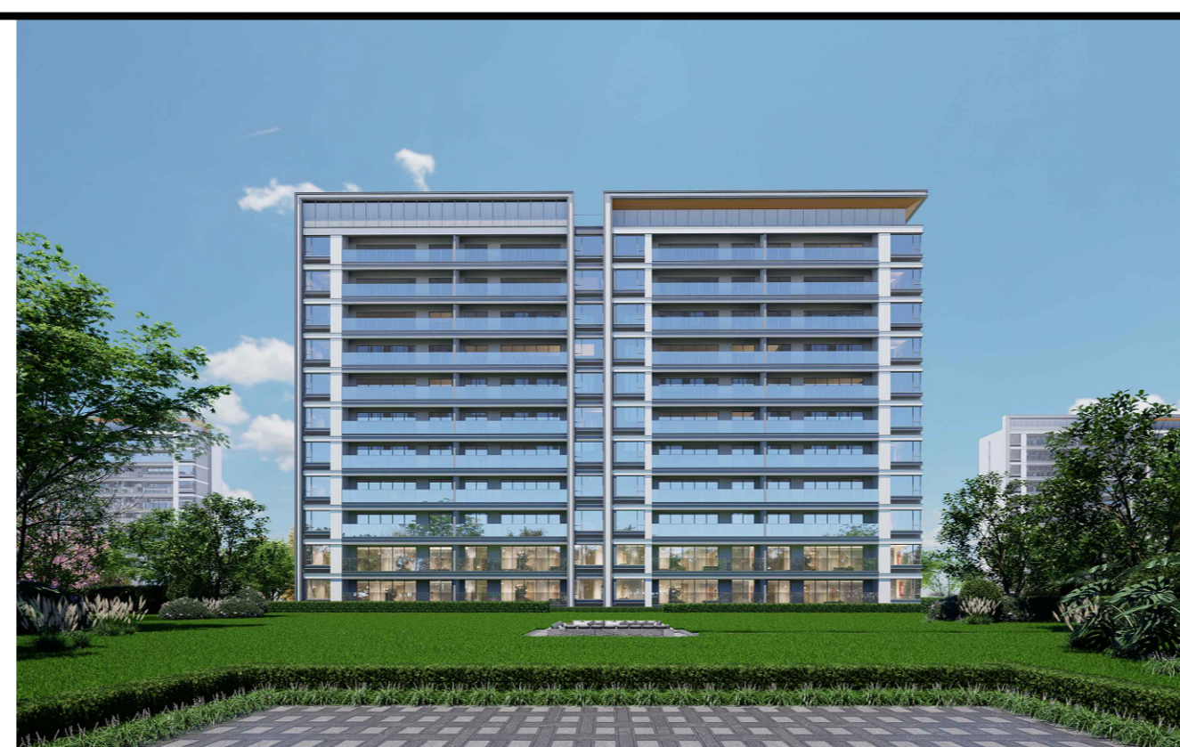
变更前单体效果图 (仅为示意)